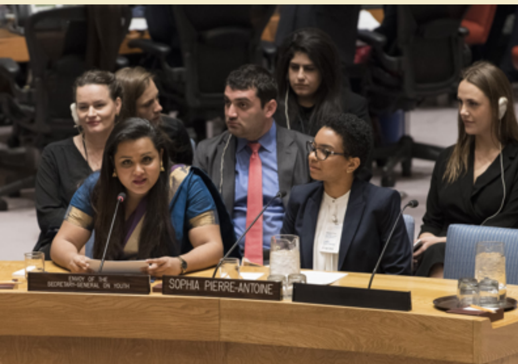
Débat public du Conseil de sécurité des Nations Unies - Maintien de la paix et de la sécurité internationales : les jeunes et la paix et la sécurité, avril 2018

Cette recherche a également permis d'identifier les lacunes dans les connaissances existantes en matière de jeunesse, de paix et de sécurité